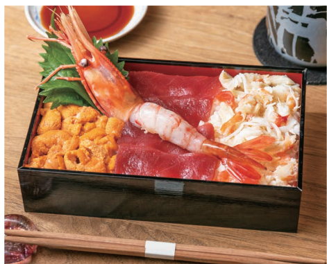
北海四色丼 4,500- HOKKAI 4 COLORS DON (4,860-)