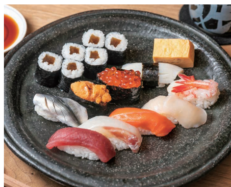
政にぎり 2,500- MASA NIGIRI (2,700-)