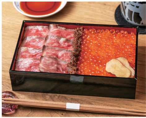
ローストビーフ丼 4,500- ROAST BEEF DON (4,860-)