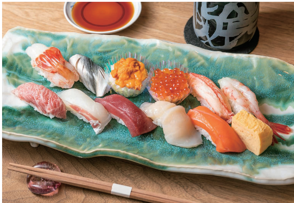
特上 政にぎり SPECIAL MASA NIGIRI 4,500- (4,860-)