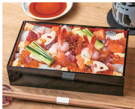
政ちらし 2,500- MASA CHIRASHI (2,700-)